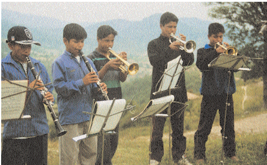
La fanfare des enfants mixtèques d'Amoltepec. Oaxaca, Mexique

Dans la région d'Otavalo, il s'agissait de se donner les instruments que l'école mettrait à profit pour développer chez les enfants la fierté de leurs origines. Il n'est pas question de les ostraciser par rapport à la société nationale, mais de faire en sorte qu'ils connaissent