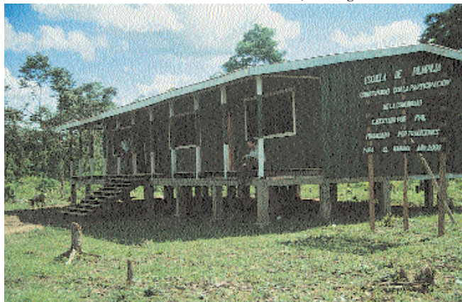
Une des écoles reconstruites sur le Rio Coco. Raan, Nicaragua

Ce projet, que les conditions locales (éloignement, insécurité) ont rendu difficile, aura aussi contribué à ressouder des villages souvent éclatés après la catastrophe.