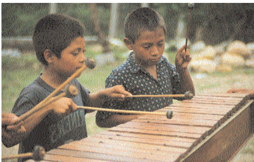
Les petits joueurs de marimba chortis. Copán, Honduras

mieux leur faune, les lieux sacrés de leurs ancêtres, le sens de ces fêtes qui se perdent, les rythmes de la nature qui les entoure.